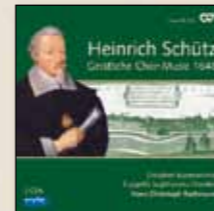
Geistliche Chor-Music Carus 83.232 (2 CDs)

historisch informiert, heute interpretiert