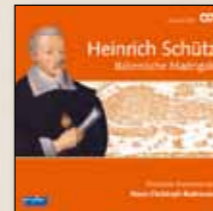
Italienische Madrigale Carus 83.237