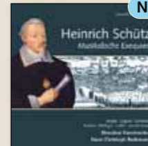
Musikalische Exequien und andere Trauergesänge Carus 83.238